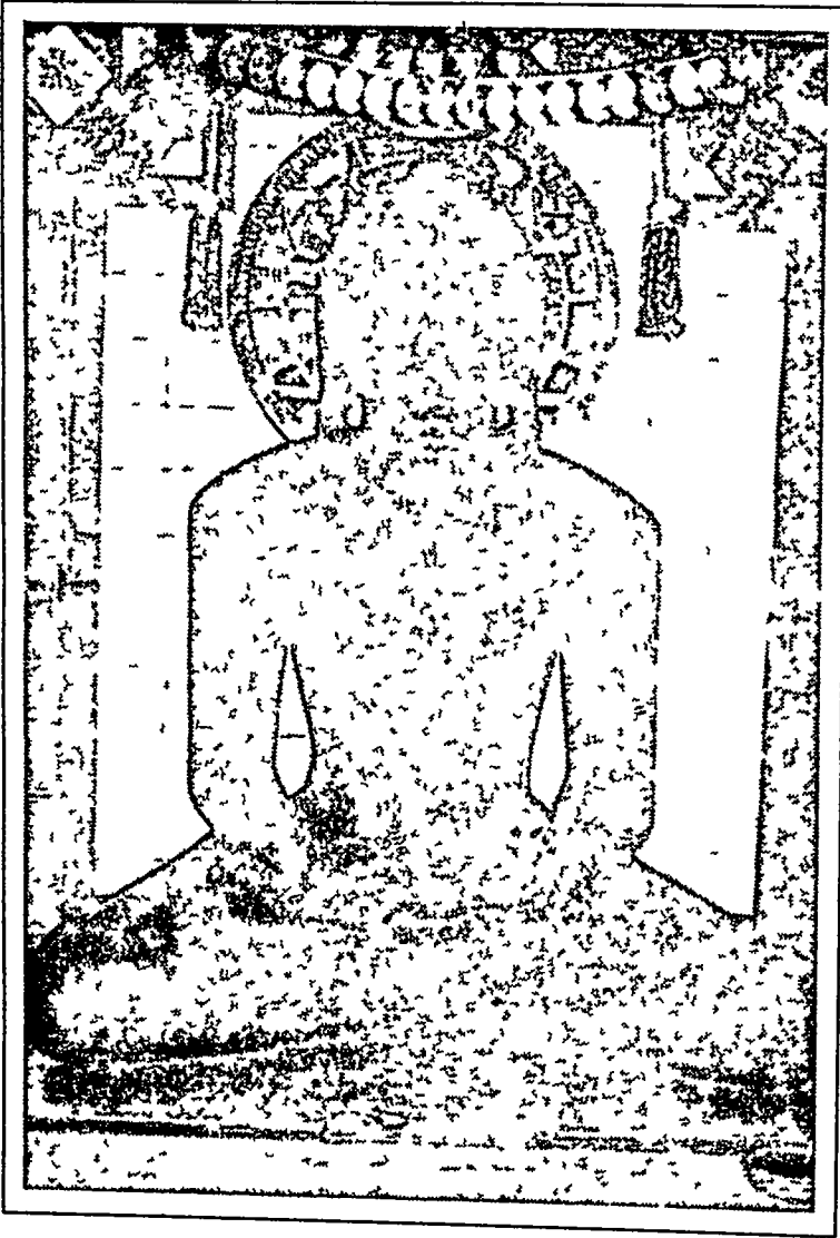
चांद खेडी के श्री ऋषभ देव भगवान